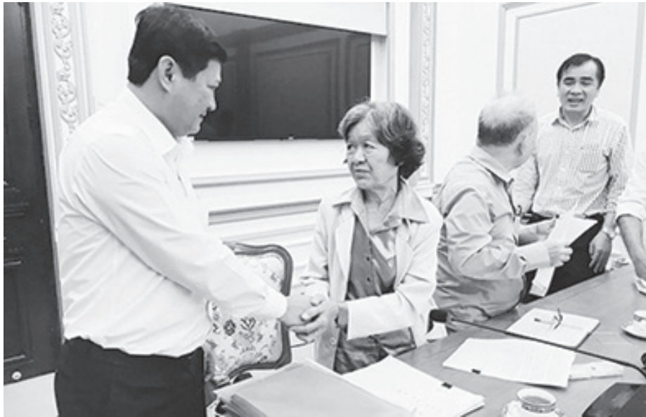
Đồng chí Huỳnh Cách Mạng, Thành ủy viên, Phó Chủ tịch UBND thành phố, trong một buổi tiếp công dân.