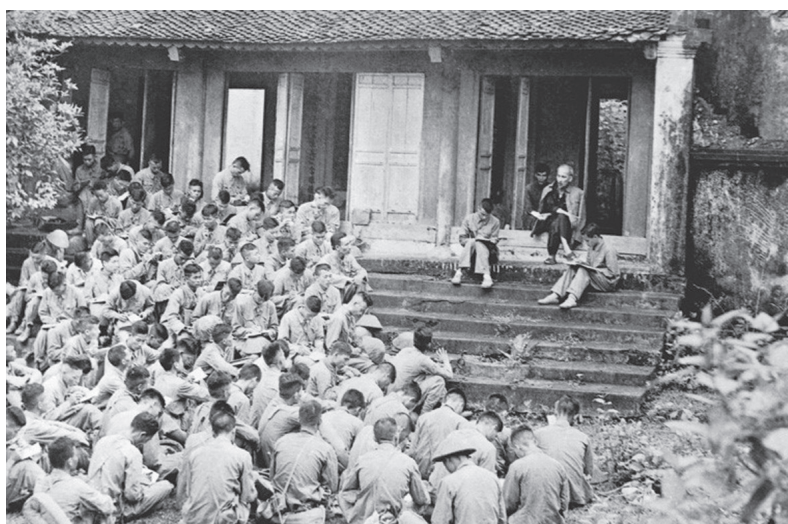
Nói chuyện với cán bộ Đại đoàn Quân tiên phong tại Đền Hùng, tỉnh Phú Thọ, Chủ tịch Hồ Chí Minh căn dặn: “Các vua Hùng đã có công dựng nước, Bác cháu ta phải cùng nhau giữ lấy nước” (ngày 19-9-1954).

Đặc biệt, Người hết sức chăm lo công tác xây dựng Đảng trong quân đội, thực hiện nguyên tắc Đảng lãnh đạo tuyệt đối, trực tiếp, toàn diện, mọi mặt đối với lực lượng vũ trang nhân dân. Chủ tịch Hồ Chí Minh đặc biệt quan tâm xây dựng đội ngũ cán bộ quân đội, Người nói: “Tướng